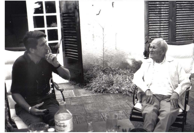
Adami e Mirò a Saint Paul-de-Vence