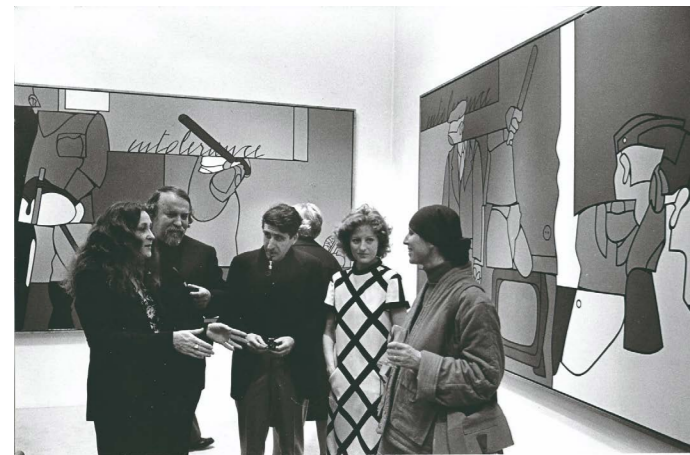
Galerie Maeght di Parigi

"Pittore attualissimo, e pittore fedele alla pittura. Ma dipingere, per Adami, non è gettare colori sulla tela, è scrivere. Non è sistemare o sollecitare gli oggetti, ma oggettivare pittoricamente il ritorno del reale in una coscienza in frantumi, 'Quando dipingo, non sono che un cartografo', ma il cartografo dei cataclismi quotidiani, delle epidemie circoscritte, dei crolli imminenti e del futuro